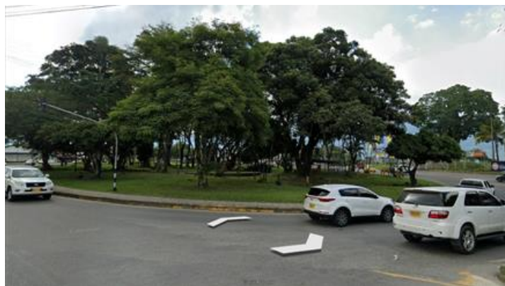
Registro fotográfico del proyecto