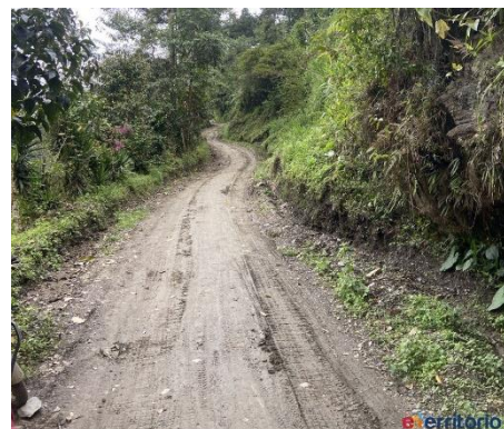
Registro fotográfico del proyecto