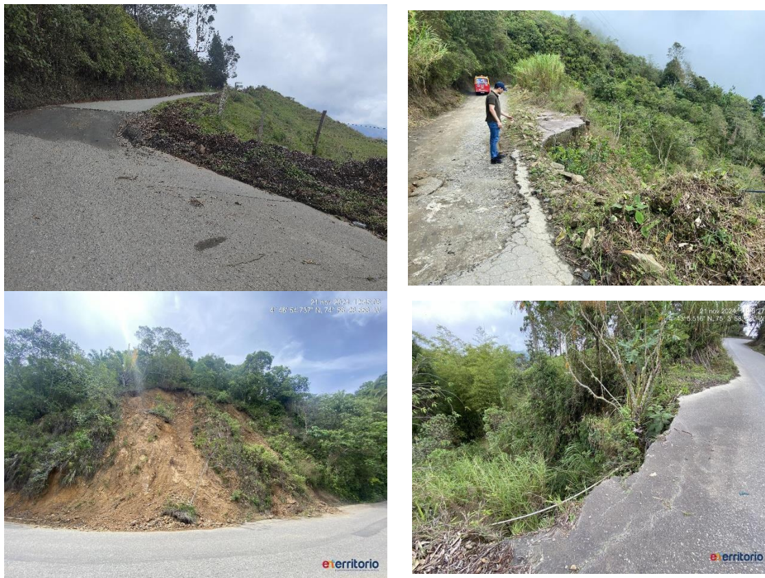
Registro fotográfico del proyecto