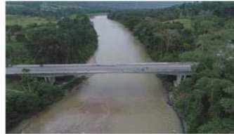
Vista Superior Obra diseño y Construcción Puente Rojo- sobre el Río Tarra

Estado: Terminado – Ejecución 100% Acta de Inicio: firmada el 03 de septiembre del 2014 Acta de Finalización: 7 de mayo de 2016