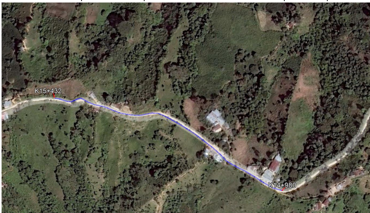
Localización detallada del tramo 1 de placa huella a intervenir el municipio de Venadillo 452 m.