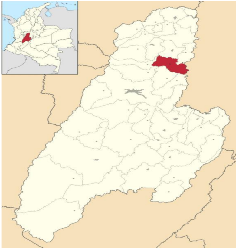
Localización espacial del municipio de Venadillo – Tolima