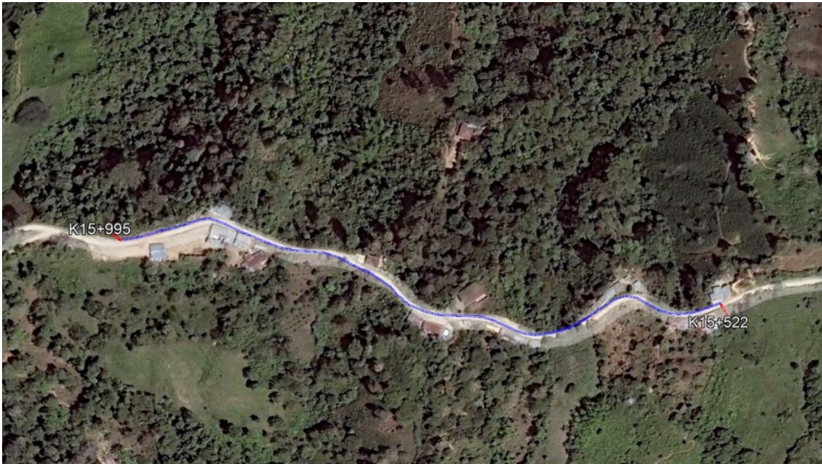
Localización detallada del tramo 2 de placa huella a intervenir el municipio de Venadillo 473 m.