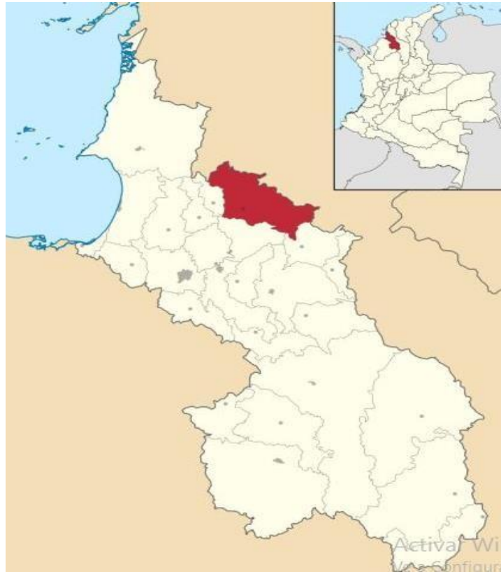
Localización de la alternativa Mapa político municipio de Ovejas Sucre