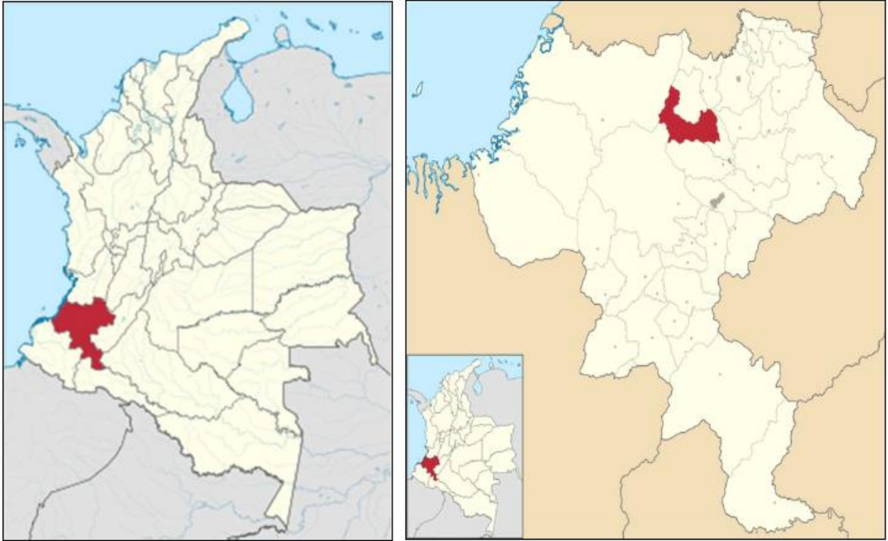
Localización del Departamento del Cauca y el municipio de Morales.