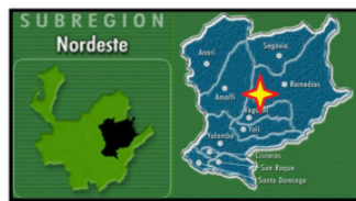
Ilustración 1. Mapa donde se realizará el proyecto

Adicionalmente, el listado de viviendas podrá ser consultado en el Anexo No. 15a (Listado de usuarios y localización.)