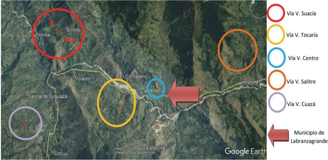
Imagen 3., Localización de sitio de intervención del proyecto P.H Labranzagrande.

El proyecto se encuentra localizado en las Veredas Tocaría, Salitre, Suacía, Cuazá y Centro del municipio de Labranzagrande ubicado en la provincia de La Libertad en el Departamento de Boyacá.