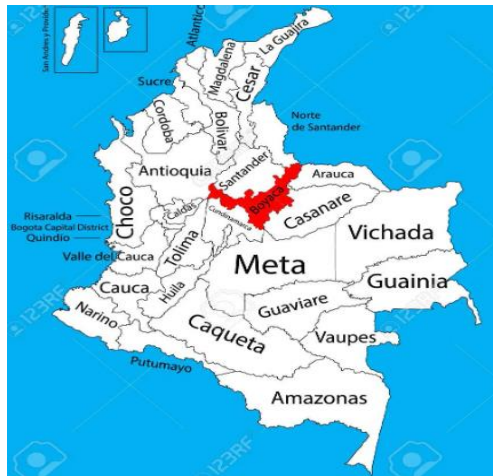
Imagen 1. Ubicación departamento de Boyacá.

El proyecto se desarrollará en área rural del municipio de Labranzagrande, departamento de Boyacá. Labranzagrande se encuentra a una distancia de referencia aproximada de 290 km de Bogotá D.C. y a 170 km aproximadamente de la ciudad de Tunja capital del departamento.