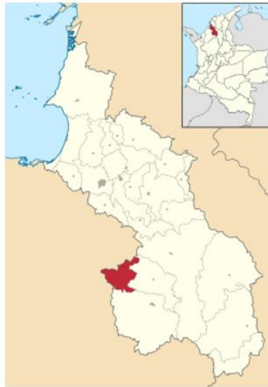
Localización general del proyecto. Colombia, Sucre, La Unión.

Sincelejo, por vías (tramos) destapadas en mal estado y pavimentadas en tramo lineal hacia Sampués. El Municipio de La Unión se encuentra a una altura media de 56 metros sobre el nivel del mar.