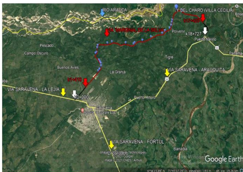
Imagen 2. Localización general de la zona de trabajo.

La ejecución del proyecto se localiza en el área Rural del municipio de Saravena. El Tramo de Vía Terciaria a intervenir, tiene como Punto de Inicio en el K1+410 hasta el Punto Final de la Intervención en el K17+420 (de la Vía Terciaria denominada "La Marginal de la Selva").