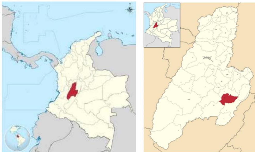
Ilustración 1 -localización Departamento de Tolima y Municipio de Prado – Tolima

Localización particular La vía se localiza en la zona rural del municipio de Prado, desde la vereda de Aco (K0+000) hasta la vereda Altagracia (K5+090). El tramo por intervenir se describe en la figura donde se incorpora las coordenadas de inicio y fin del para su localización.