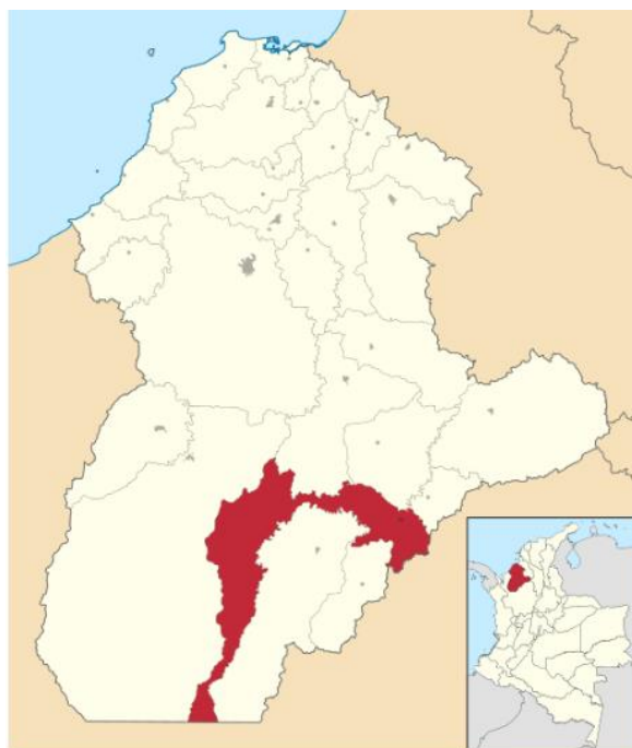
Imagen 1. Localización del municipio de Montelíbano, departamento de Córdoba.

Cuenta con una extensión total de 1899 km 2 y coordenadas geográficas 75° 26' 25" de longitud oeste y 7° 59' 13" de latitud Norte, situado en el valle del río San Jorge y es uno de los centros económicos, comerciales y culturales más importantes de la región. En la siguiente figura se observa la ubicación del departamento de Córdoba con respecto a Colombia, y a su vez, la ubicación del municipio de Montelíbano con respecto a Córdoba.