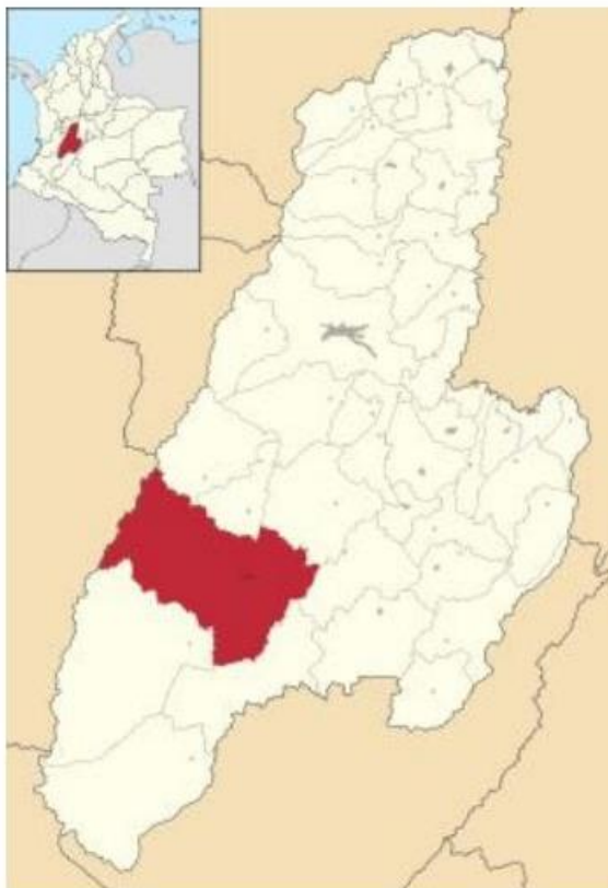
Imagen 1 -localización General del proyecto Departamento del Tolima – Municipio de Ataco.

Límites y Acceso: Los límites municipales, de acuerdo a las Ordenanzas que lo erigieron como Municipio y la que le cercenó el espacio que hoy define al Municipio de Rioblanco son: Al Norte: con los Municipio de Roncesvalles, San Antonio y Ortega Al Oriente: limita con los municipios de Coyaima y Ataco Al Sur: con los municipios de Rioblanco y Ataco Al Occidente: con los municipios de Tuluá, Buga, Cerrito y Pradera localizados en el departamento del Valle del Cauca.