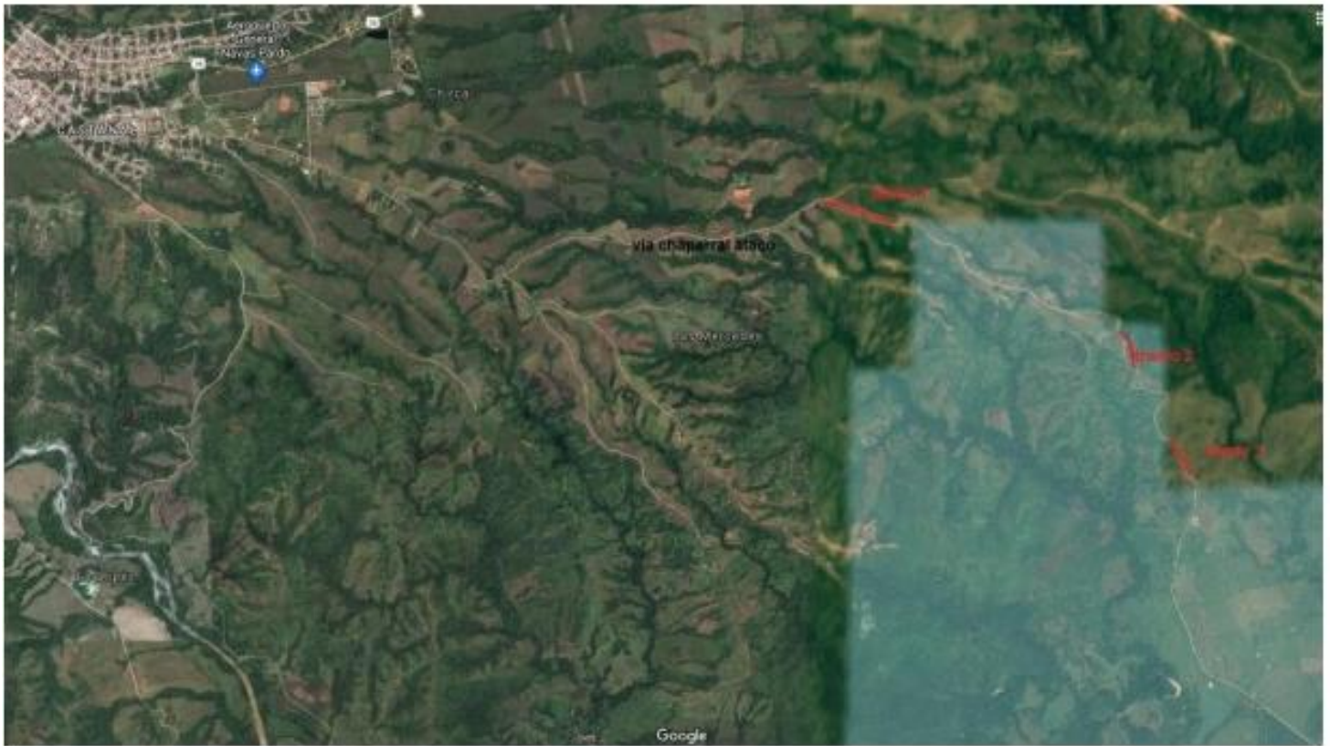
Imagen 2. Localización relativa del tramo 1, tramo 2 y tramo 3 de las veredas de PIPINI, AMOYA Y GUAINI del proyecto Placa Huella. (Google Maps).

Localización del Proyecto en Coordenadas: