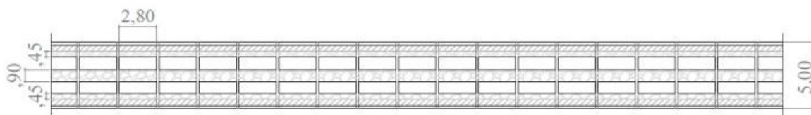
Vista en planta