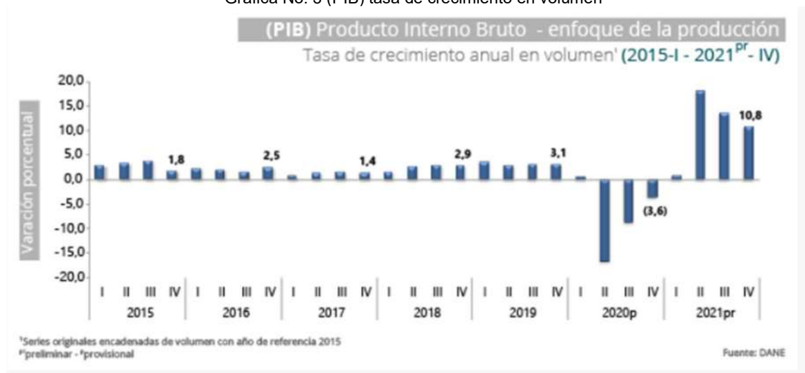
Grafica No. 3 (PIB) tasa de crecimiento en volumen

Respecto al trimestre inmediatamente anterior, el Producto Interno crece (4,3%). Esta variación se explica principalmente por la siguiente dinámica: Información y comunicaciones crece (4,7%.); Comercio al por mayor y al por menor; Reparación de vehículos automotores y motocicletas; Transporte y almacenamiento; Alojamiento y servicios de comida crece (4,6%); y Construcción crece (4,3%). 3