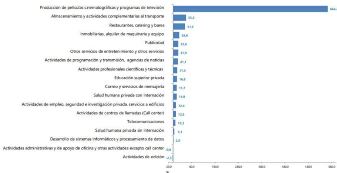
Grafica No. 4 variación anual de los ingresos nominales, según subsector de servicios Total Nacional- diciembre 2021

Recientemente, el DANE en su Boletín Técnico - Encuesta Mensual de Servicios - EMS con corte a diciembre de 2021, que tiene por objeto, obtener la información de las variables principales del sector servicios para el análisis de su evolución en el corto plazo, reveló el valor agregado de todos los subsectores que hacen parte de este sector de la economía, en línea con lo observado en los últimos años.