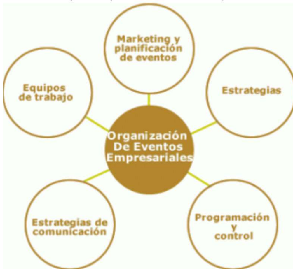
Imagen No. 1 Organización de eventos – factores implicados

Se establece que un operador logístico, es un aliado estratégico que se le encarga el diseño y la organización de todos los aspectos logísticos de la empresa contratante, con el fin de realizar los eventos institucionales, jornadas o talleres de capacitación y demás actividades requeridas.