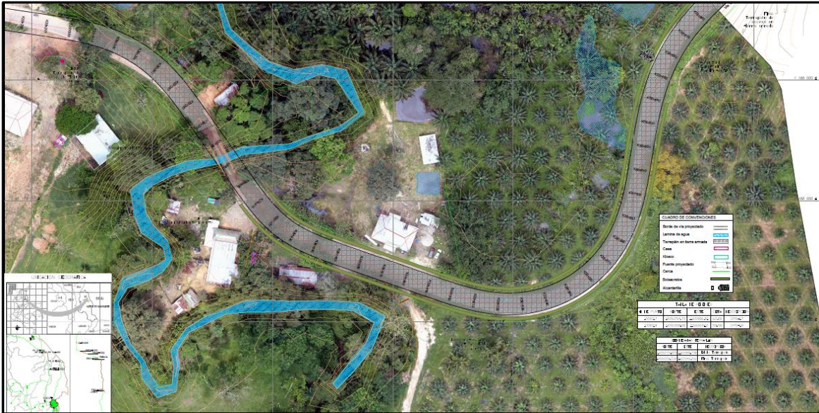
Ilustración 2 Planta general de localización de proyecto Tramo vial K39 + 290 – K39 + 740 Puente 9, Vía Astilleros – Tibú.