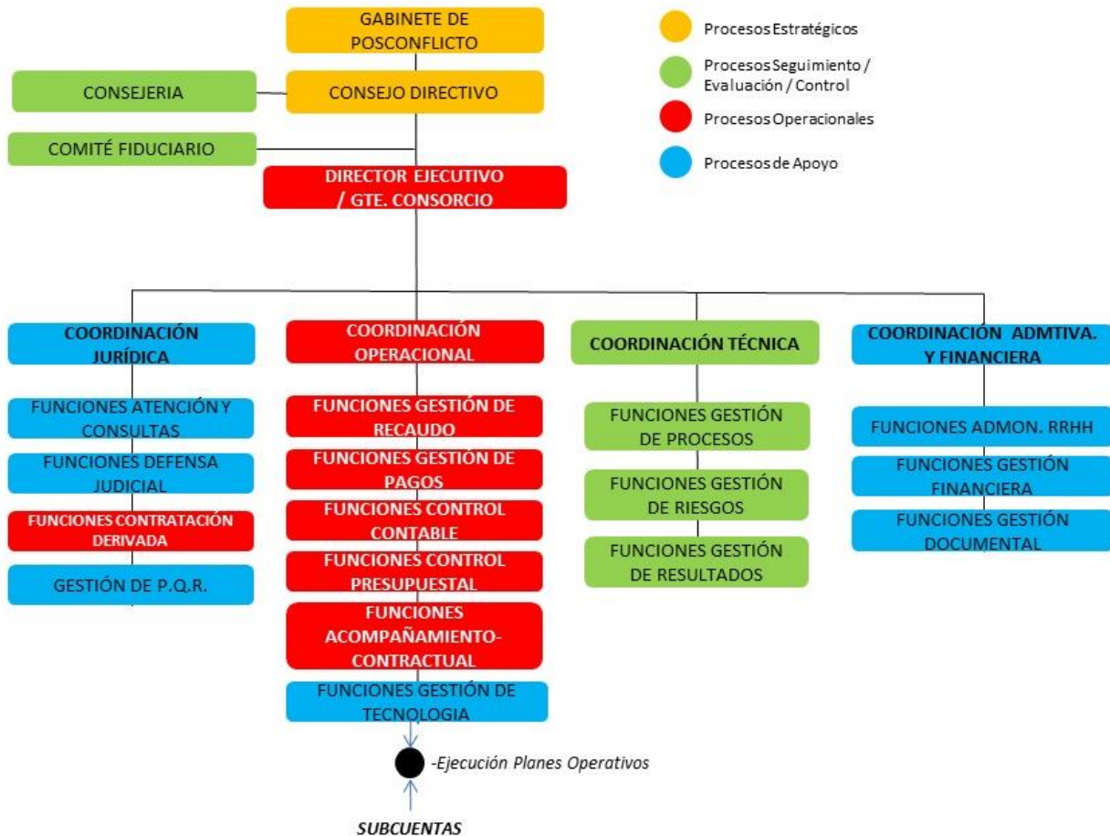
Ilustración 3. Estructura Funcional Unidad Técnica FCP