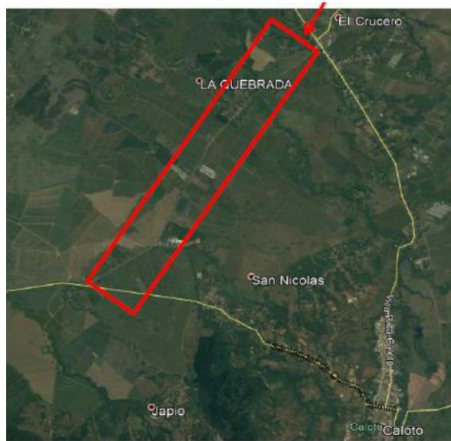
Mapa de localización del proyecto .