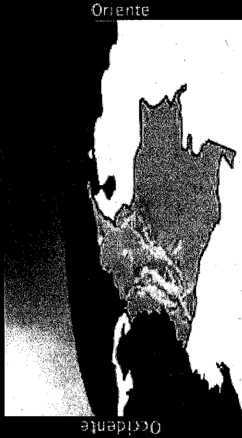
Posición actual aproximada del Sol respecto a Colombia

Esta hora es tomada de los patrones de referencia del Laboratorio de Tiempo y Frecuencia del Instituto Nacional de Metrología.