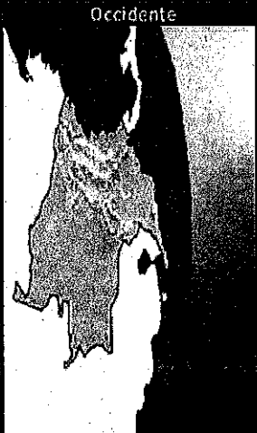
Posición actual aproximada del Sol respecto a Colombia

La exactitud del tiempo que se visualiza depende de las características de su equipo y la comunicación de Internet que se encuentra instalada en su computador.