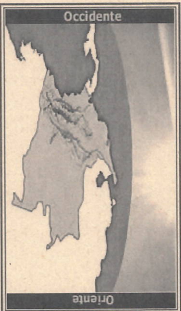
Posición actual aproximada del Sol respecto a Colombia

De acuerdo con lo establecido en el numeral 14 del artículo 6 del Decreto número 4175 de 2011, el Instituto Nacional de Metrología mantiene, coordina y difunde la hora legal de la República de Colombia.