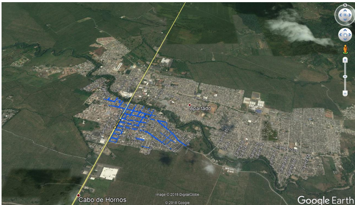
Imagen 1. Localización de las redes a reponer.

A continuación, se presenta una imagen con la localización principal de las redes a reponer del sistema de acueducto.