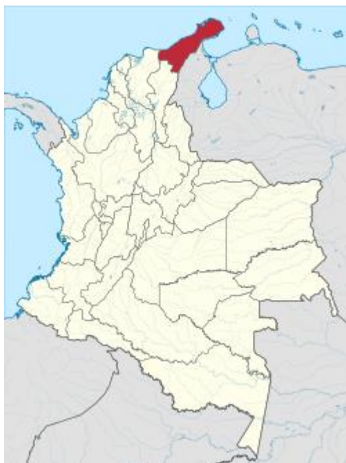
Localización del municipio de Maicao en el Departamento de La Guajira.