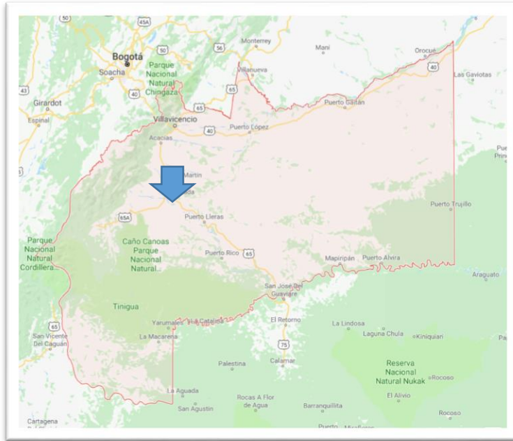
Ilustración 2 Mapa del departamento del Meta