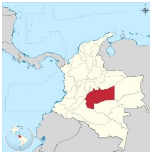
Ilustración 1 Mapa de ubicación del departamento del Meta en el territorio colombiano