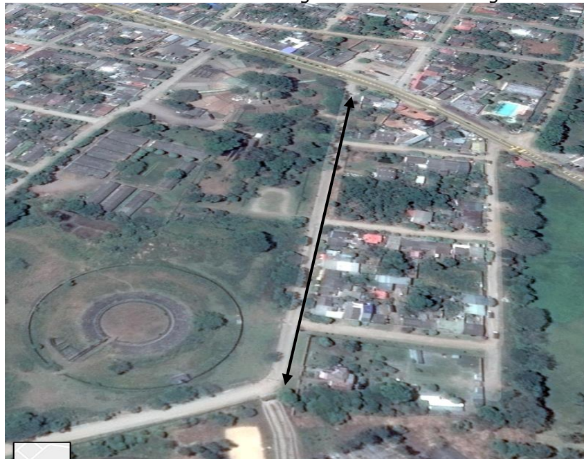
Ilustración 5 Mapa del Municipio de San Martín de los Llanos ubicación de la vía